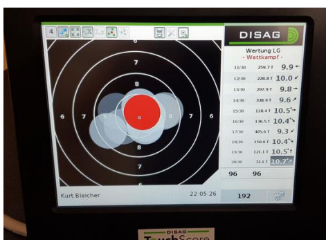
DISAG SIZ Monitor mit Trefferbild

Die Inntaler rüsten auf elektronische DISAG OpticScore Schießstände um, bei dem Umbau wurden in freiwilliger Arbeit ca. 560 Arbeitsstunden geleistet! Neben der Ausrüstung des Schießstandes mit elektronischen Messrahmen und dem Schützenmonitor für die Scheibendarstellung, ist auch die Visualisierung der Schießergebnisse im Gastraum umgesetzt worden. Die Steuerung der gesamten Schießanlage erfolgt über einen PC. Der OpticScore Messrahmen bildet das Herzstück der elektronischen Schießanlage. Auf einer Distanz von 10 Metern werden die Geschosse mit höchster Genauigkeit vermessen. Die Schussposition wird in Echtzeit an das SIZ übermittelt. Das Schützeninformationszentrum stellt die Schüsse für den Schützen auf dem Monitor da und leitet die Ergebnisse für die anschließende Auswertung an den PC weiter. Die leicht verständliche Bedienung nimmt selbst unerfahrenen Schützen schnell die letzten Bedenken im Umgang mit einer elektronischen Schießanlage.